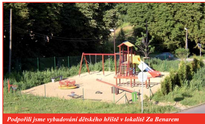
Podpořili jsme vybudování dětského hřiště v lokalitě Za Benarem

Při jednáních zastupitelstva jsme podpořili vznik Fondu na obnovu domů jako vhodnou aktivitu na podporu snahy občanů ve Slaném o zlepšení vzhledu jejich domů. Za tři roky trvání tohoto fondu bylo z městského rozpočtu i námi podpořeno několik desítek akcí za cca 11,5 milionů korun.